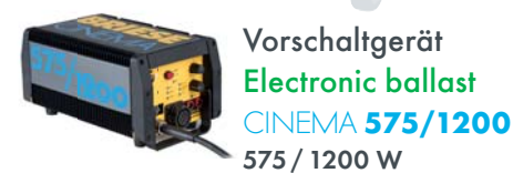
Vorschaltgerät Electronic ballast CINEMA 575/1200 575 / 1200 W

This provides the opportunity to modify the character of light as required.