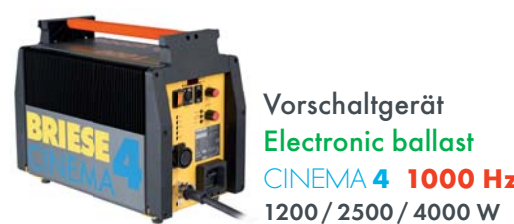
Vorschaltgerät Electronic ballast CINEMA 4 1000 Hz 1200 / 2500 / 4000 W

90 – 125 V / 180 – 250 V DMX 300 Hz / flickerfree 75 Hz / 60 Hz (B x T x H) 24,3 x 35,8 x 45 cm Gewicht Weight ca. 19,5 kg Art. 40422222