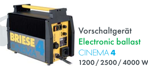
Vorschaltgerät Electronic ballast CINEMA 4 1200 / 2500 / 4000 W

180 – 250 V DMX 300 Hz / flickerfree 75 Hz / 60 Hz (B x T x H) 20 x 15 x 33,5 cm Gewicht Weight ca. 8 kg Art. 40322222