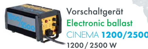
Vorschaltgerät Electronic ballast CINEMA 1200/2500 1200 / 2500 W

90 – 130 V / 180 – 250 V DMX 300 Hz / flickerfree 75 Hz / 60 Hz (B x T x H) 20 x 15 x 33,5 cm Gewicht Weight ca. 8 kg Art. 40222222