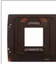
WDS-611 WDS 哈苏-V系列卡口