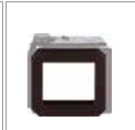
WRS-1068 玛米亚6x8电动菲林背卡口