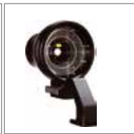
WDS-580 120°广角相机取景器 (冷靴接口)