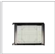
WDS-615 磨砂玻璃对焦屏 (H1卡口)