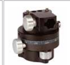
WDS-250 WRS 木手柄