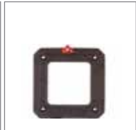
SLW-81 利图 AFi / 禄来Hy6卡口