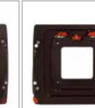
WDS-618 WDS 利图 AFi / 禄来Hy6卡口