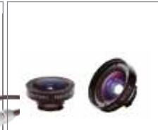
苹果iPhone转换至165°广角镜头