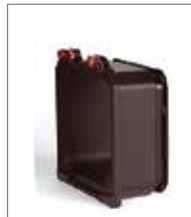
WDS-1048 WRS 48毫米 增距环 WDS-1017 WRS 17毫米 增距环 WDS-1010 WRS 10毫米 增距环