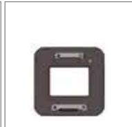
SLW-87 康泰时 645AF卡口