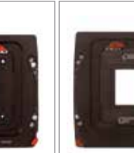
WDS-617 WDS 康泰时 645AF卡口