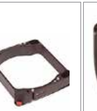
玛米亚 RB 6x8菲林后背