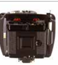
WDS-616 WDS对焦放大镜 (适配WDS-615/619)