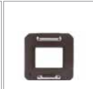
SLW-88 玛米亚 645AFD卡口