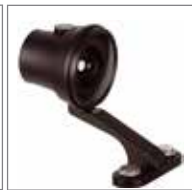
WRS-1080 双螺栓锁定取景器