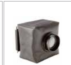
WDS-630 可微调直视放大镜取景器