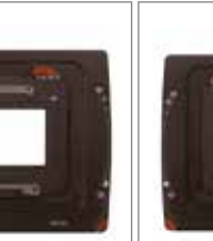
WDS-614 玛米亚 645AFD卡口