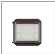
WDS-619 磨砂玻璃对焦屏 (适配SLW)